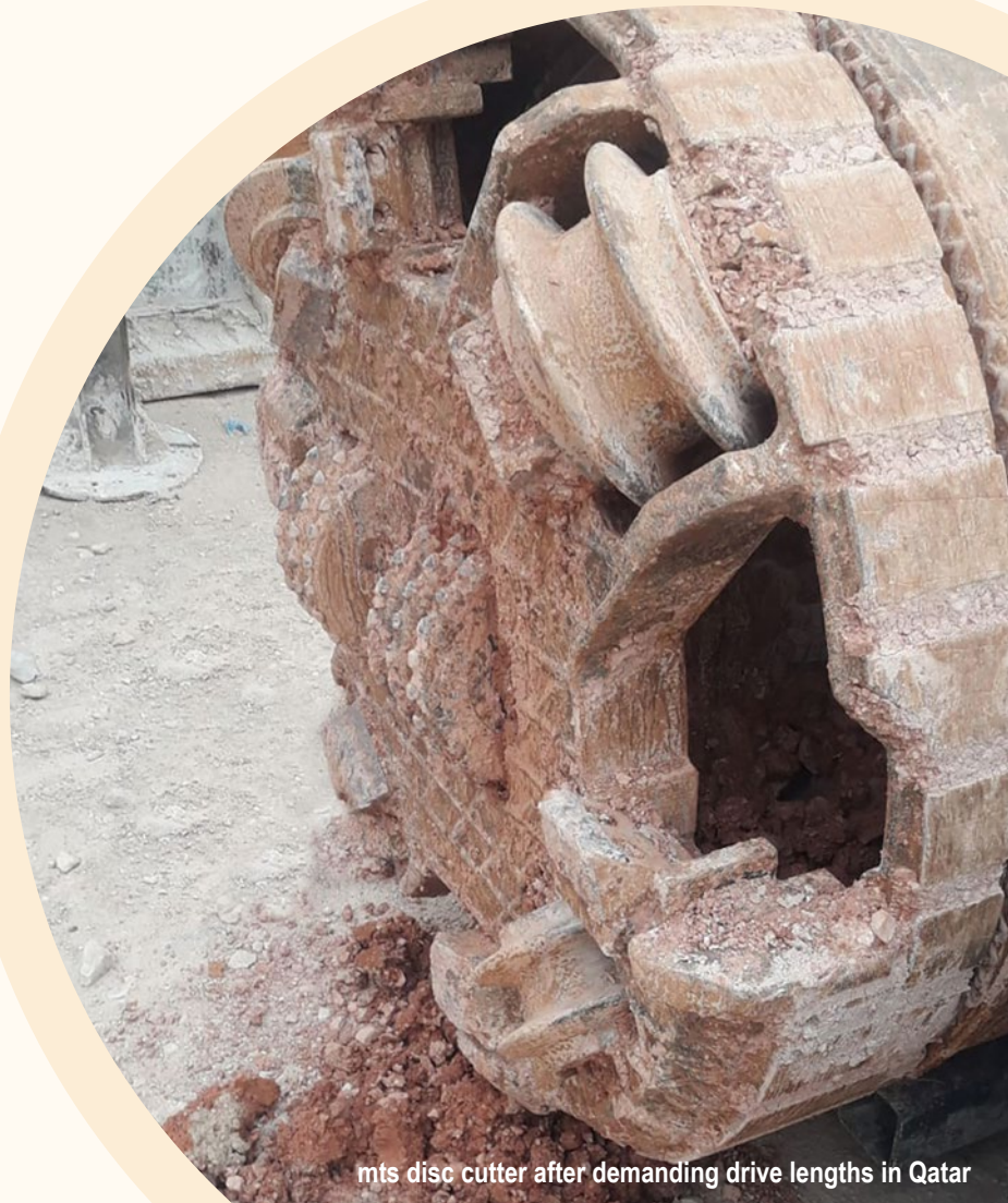
mts disc cutter after demanding drive lengths in Qatar

Die Realisierung anspruchsvoller Produktanforderungen ist unser Tagesgeschäft - Kontaktieren Sie uns, wenn Sie langlebige Schneidrollen benötigen!